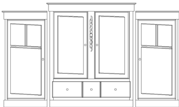
MEUBLE AVEC PORTES NON ALIGNÉES